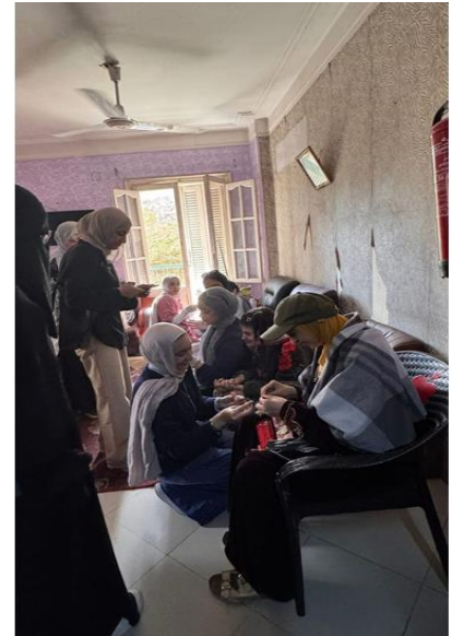
منسق لجنة الانشطة الطلابيه